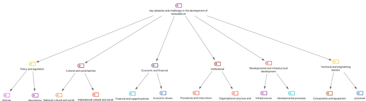
شکل 5 نمایی از مدل درختی موانع و چالش‌های کلیدی توسعه انرژیهای تجدیدپذیر در کشورهای اروپایی و آسیایی