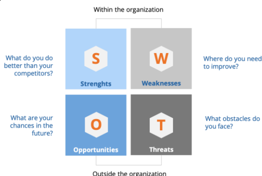
Figure 1. SWOT analysis matrix

The SWOT analysis method (Figure 1) is a useful analytical model that systematically analyzes the identified strengths, weaknesses, opportunities, and threats and ultimately identifies appropriate strategies [6].